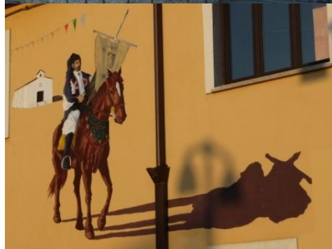
buscando una vía en los montes